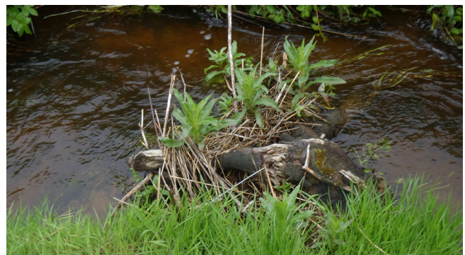
Udlagt træerod hvor det tydeligt ses, hvordan der skabes variation i vandets strømning.

Et generelt problem med træ i vandløb er at materialet er forgængeligt. Der kan derfor over tid være behov for at følge op på restaureringen og evt. supplere udlægningen efterhånden, som det udlagte træ rådner. Udlægning af træerødder kan gøre behovet for opfølgning mindre, da rødder er mindre forgængelige end resten af træet. Derudover er røddernes densitet anderledes end træstammer og grene, og rødderne flyder derfor ikke så let. Begge disse egenskaber medfører at træerødder er oplagte til restaurering af vandløb.