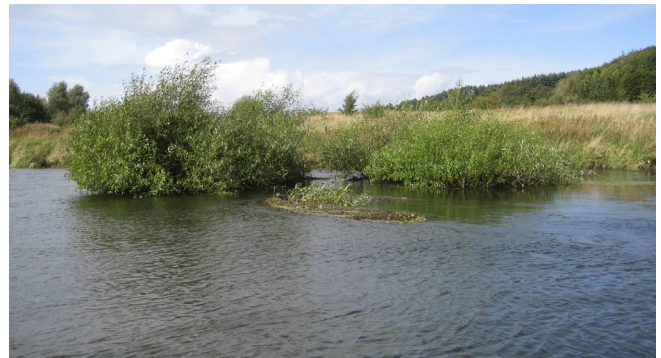
Væltet og efterladt piletræ i Gudenåen.