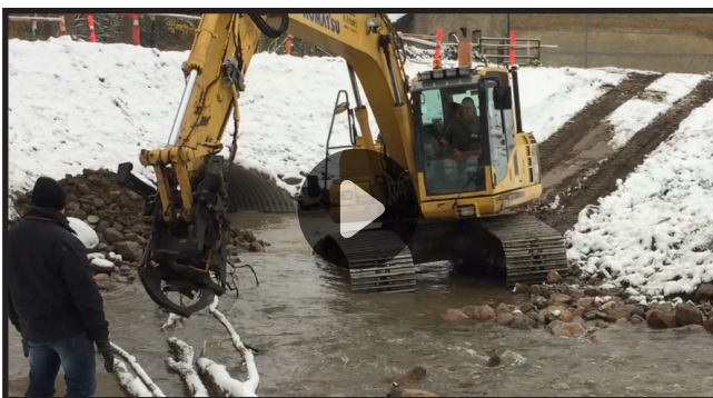
Klik og se hvordan der er ved restaurering af Skærup Å ved Brøndsted Mølle, udlægges og fæstnes træstammer.

Omkostningerne forbundet med denne metode afhænger bl.a. af om det anvendte træ kan skaffes lokalt. Ved genslyngninger skal der ofte ryddes træer, og anvendes disse til restaureringen, vil der ikke være ekstra udgifter forbundet ved udlægningen. Skal træstammerne derimod køres til vandløbet, kan udgiften være betydelig, og størrelsen afhænger af hvor langt materialet skal transporteres.