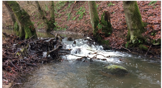
Samling af grene der udgør en potentiel spærring i Højen Å.

for er vist et billede fra Højen Å i Vejle Kommune hvor en samling træstykker mellem to træstammer er i risiko for at være en spærring for fisk i vandløbet. I det konkrete tilfælde viser optælling af gydegravninger dog at der har været passage for fisk i vandløbet, da der blev fundet mange gydninger fra havørreder opstrøms denne og andre samlinger af træstykker. Nedenstående billede er taget ved en relativ lav vandføring og ved denne vandføring er passageforholdene nok begrænsede, men ved højere vandføringer er det muligt for fisk at passere.