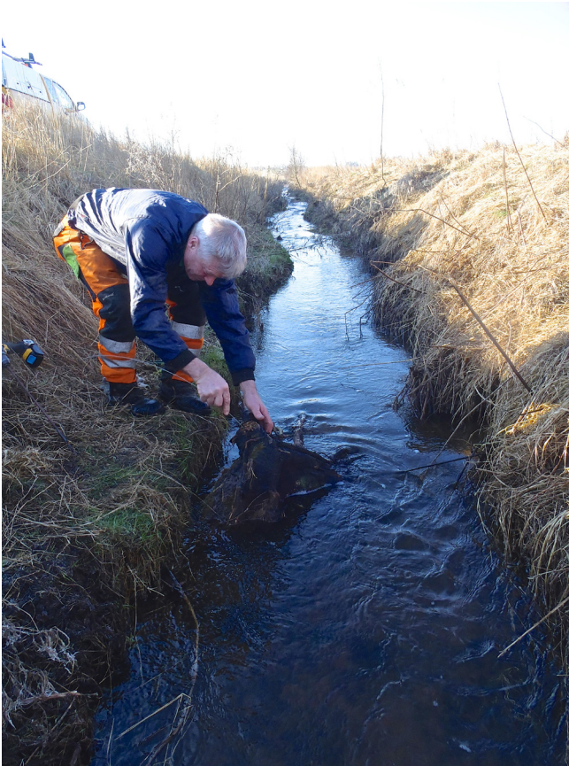
Fæstning af trærod i Grundel Bæk vha. stålwire.