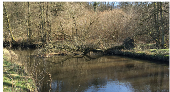
Væltet træ i Vejle Å.

Når træer vælter ned i vandløbet er det med til at skabe ændringer i de fysiske forhold samt nye levesteder for fisk og smådyr. Er disse ændringer til gavn for vandløbet kan man lade det væltede træ ligge. Anvendes denne metode til restaurering af vandløb er der dog en række overvejelser, som eksempler fra Vejle Å og Gudenåen viser.