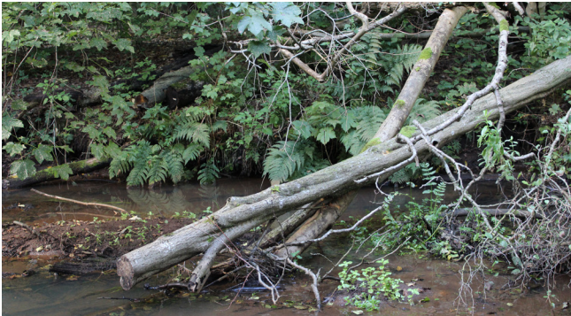
Væltet træ tilpasset efter vandløbets regulativmæssige bredde.

hold i en positiv retning. Den bedste metode til at få flere grene og kviste i vandløbene er ved at lade dem der falder i ligge. Mange steder fjernes grene og kviste ved vandløbsvedligeholdelsen, men de steder hvor det ikke er til gene for afstrømningen kan man lade det ligge. Processen med at skabe lidt større bunker af grene og kviste kan hjælpes på vej ved strategisk udlægning af sten eller større grene, der dermed kan virke som opsamlingspunkt for drivende grene og kviste. Metoden koster som udgangspunkt ikke noget, da den kan udføres og holdes øje med som et led i det generelle tilsyn med vandløbene.